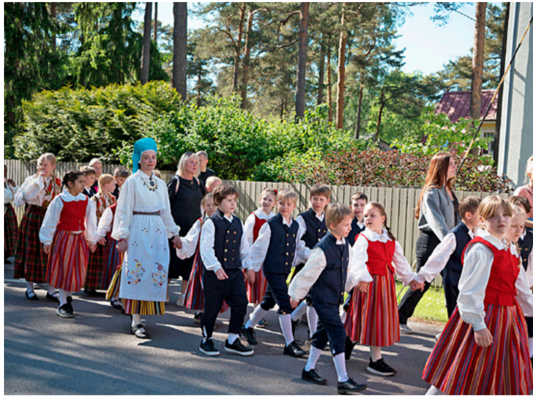
Nõmme VI laulu- ja tantsupäeva rongkäik sai alguse Rahu tänavalt ning täitis Nõmme tänavad rahvariides esinejate, laulu ja rõõmuhoisega.