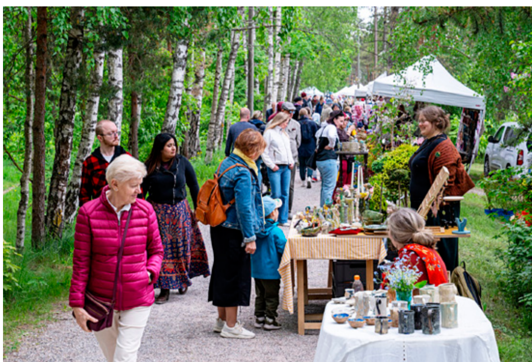
Ilus kevadilm meelitas Roheliste Väravate Tänavafestivalile tuhandeid külalisi Nõmmelt ja kaugemalt

Juubeliaasta kava täieneb jooksvalt. Vaata tallinn.ee/Nõmme100 .