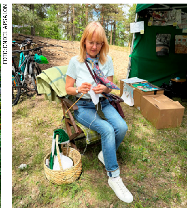
Nõmme telgi juures sai igaüks panuse anda jaamaülemale salli kudumisse. See mõte meeldis paljudele ja töönaoliselt liigub kudumisnurk ka järgmistele suvistele kogukonnaüritustele.