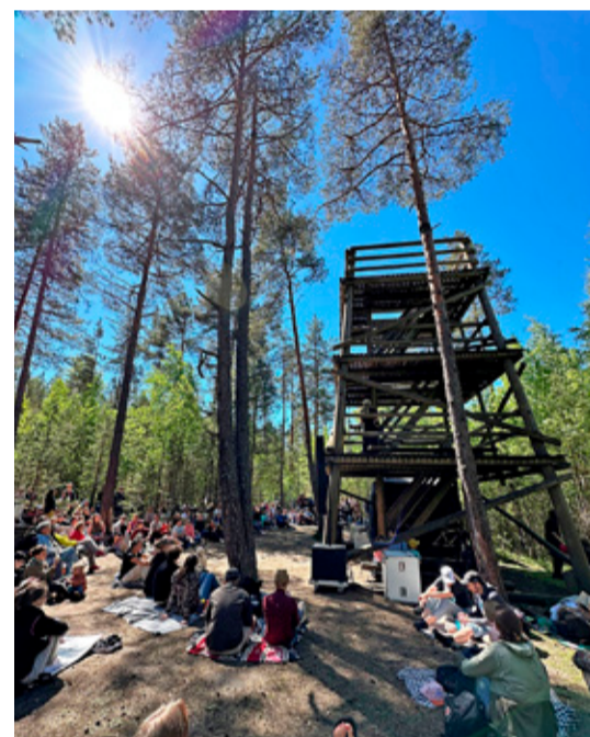
DuoRuut rabatornis. Kahe muusiku ühisel kandel loodud maagilised pärimusmuusika helid sobisid suurepäraselt rabamaastiku rahuga.