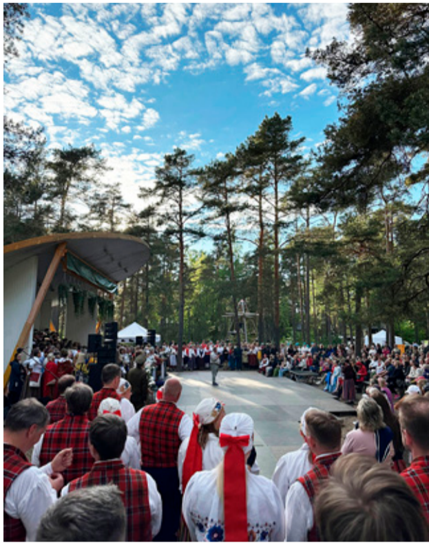
30. mail toimunud Nõmme VI laulu- ja tantsupäev tõi Vabaduse parki kokku üle 800 esineja ning arvuka publiku, pakkudes kogu päeva vältel rõõmu, liikumist ja ühislaulmist.