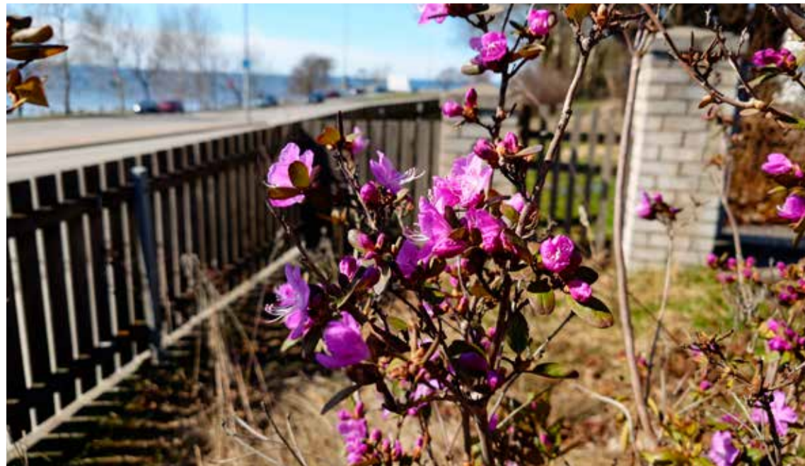
Dauria rododendron – varajane õitseja Meriväljal.