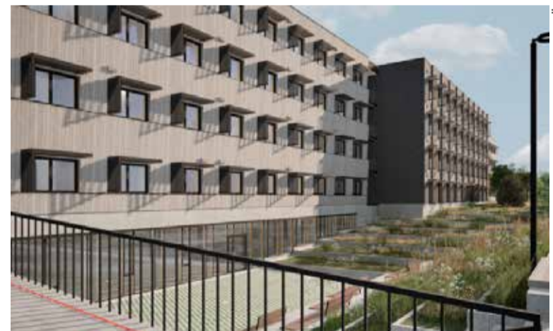
QP ARHITEKTID OÜ

Areneva, kasvava ja suure külastatavusega õppekeskuse puhul, mille ümber paiknevad tihedasti elumajad, on üks põhiküsimusi liiklus ja ligipääs. Et edaspidi kohalike elanikke võimalikult vähe häirida ning kitsastel tänavatel liikluskoormust vähendada,