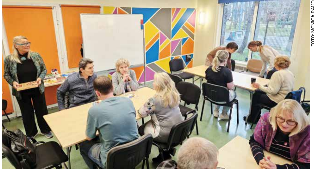
Samal ajal kui teised maja taga tennis mängisid ja noored rulapargis trikitasid, harjutas paarkümmend kohalikku eesti keeles suhtlemist.