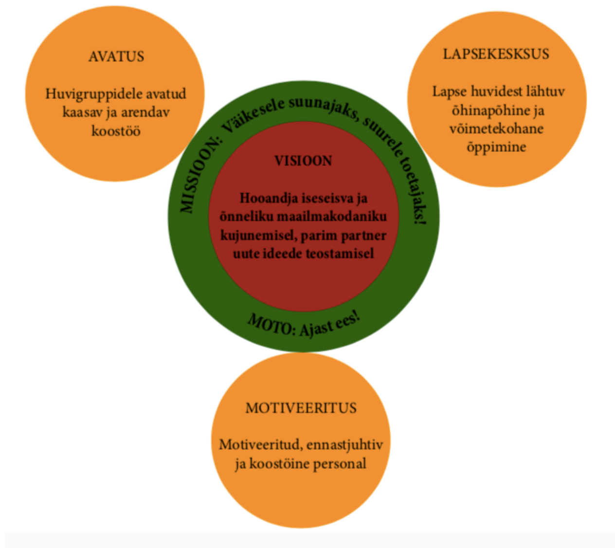
Joonis 1: Tallinna Kelmiküla Lasteaia visioon, missioon, moto ja põhiväärtused koos arengukava strateegiliste eesmärkidega